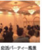
宴会パーティー風景