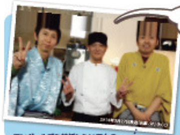
アンガールズも結婚したい男女の出会いを応援します!